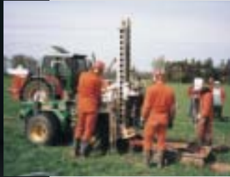
Bei der Auswahl der Schallquellen wird die örtliche Beschaffenheit des Geländes berücksichtigt.