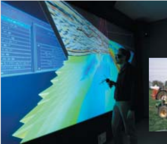
In 3D-Räumen werden die Ergebnisse der Seismik visualisiert.