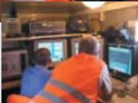
Blick in einen Messwagen während einer 3D-Seismik