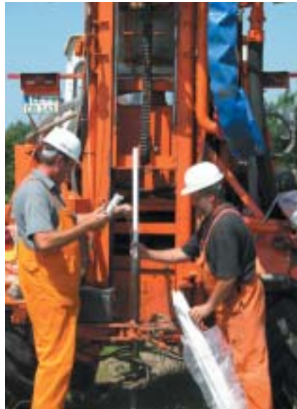
Zur Vermeidung von Schäden werden die Arbeiten sorgfältig vorbereitet.