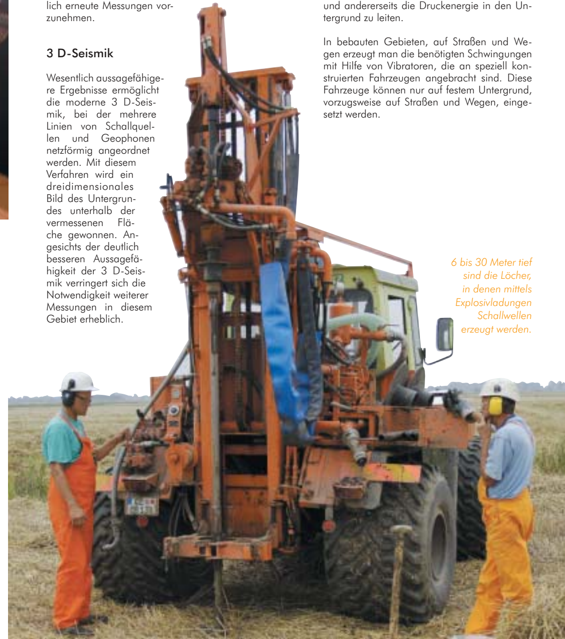
6 bis 30 Meter tief sind die Löcher, in denen mittels Explosivladungen Schallwellen erzeugt werden.

In bebauten Gebieten, auf Straßen und Wegen erzeugt man die benötigten Schwingungen mit Hilfe von Vibratoren, die an speziell konstruierten Fahrzeugen angebracht sind. Diese Fahrzeuge können nur auf festem Untergrund, vorzugsweise auf Straßen und Wegen, eingesetzt werden.